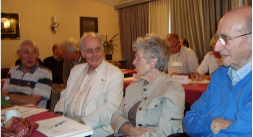
Het publiek geniet van de mooie films

Strekking: Kleding waaronder een jacquet wordt in een zak gedaan, aan de weg gezet en door een buurman meegenomen. Waarom een kledingzak aan de weg zetten? Dat was de jury niet duidelijk. ( de reacties vanuit de zaal maakte dit voor hen wel helder ) In ieder geval kende zij deze systematiek van kleding ophalen voor het goede doel niet. Het verhaal is overduidelijk gefilmd, doch te dun van structuur. Het weghalen van de zak geeft het verhaal een goede wending doch met het bezoek aan de buurman wordt de plot voor een groot deel weggegeven. Er zijn vragen over de mannelijke rol. Is hij nou zo doof dat hij de vraag van zijn vrouw niet hoort? Dat past toch niet bij zijn karakter. Wat is hij van beroep, violist of dirigent? (vanuit de zaal wordt aangegeven dat het een musicus is). De jury heeft daar toch wel wat moeite mee. De parallelmontage aan het begin van de film is erg leuk gevonden. De muziek is goed gekozen en er is een mooie titel gebruikt. De scherpteverlegging van persoon naar partituur is heel goed gedaan. De overgangen in de muziek naar dialoog is goed verzorgd. Waardering 70 – 68 – 69 Totaal: 207